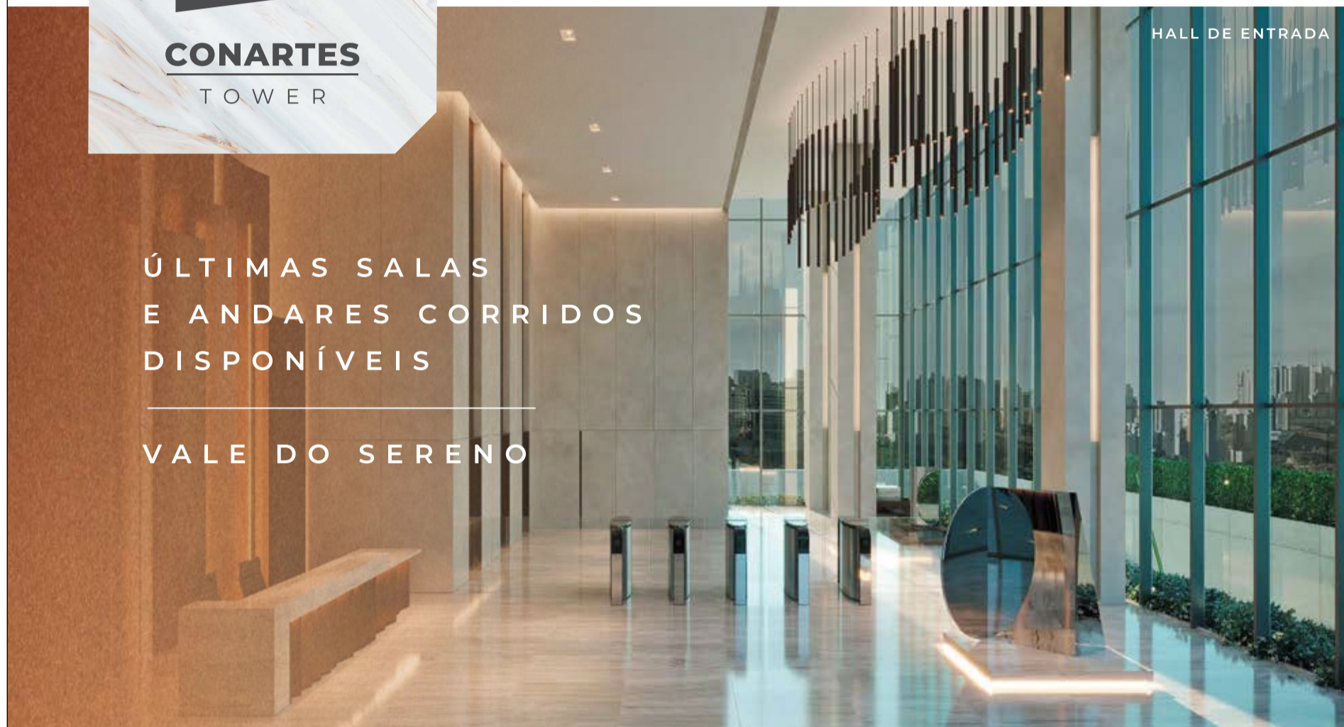
HALL DE ENTRADA

ÚLTIMAS SALAS E ANDARES CORRIDOS DISPONÍVEIS