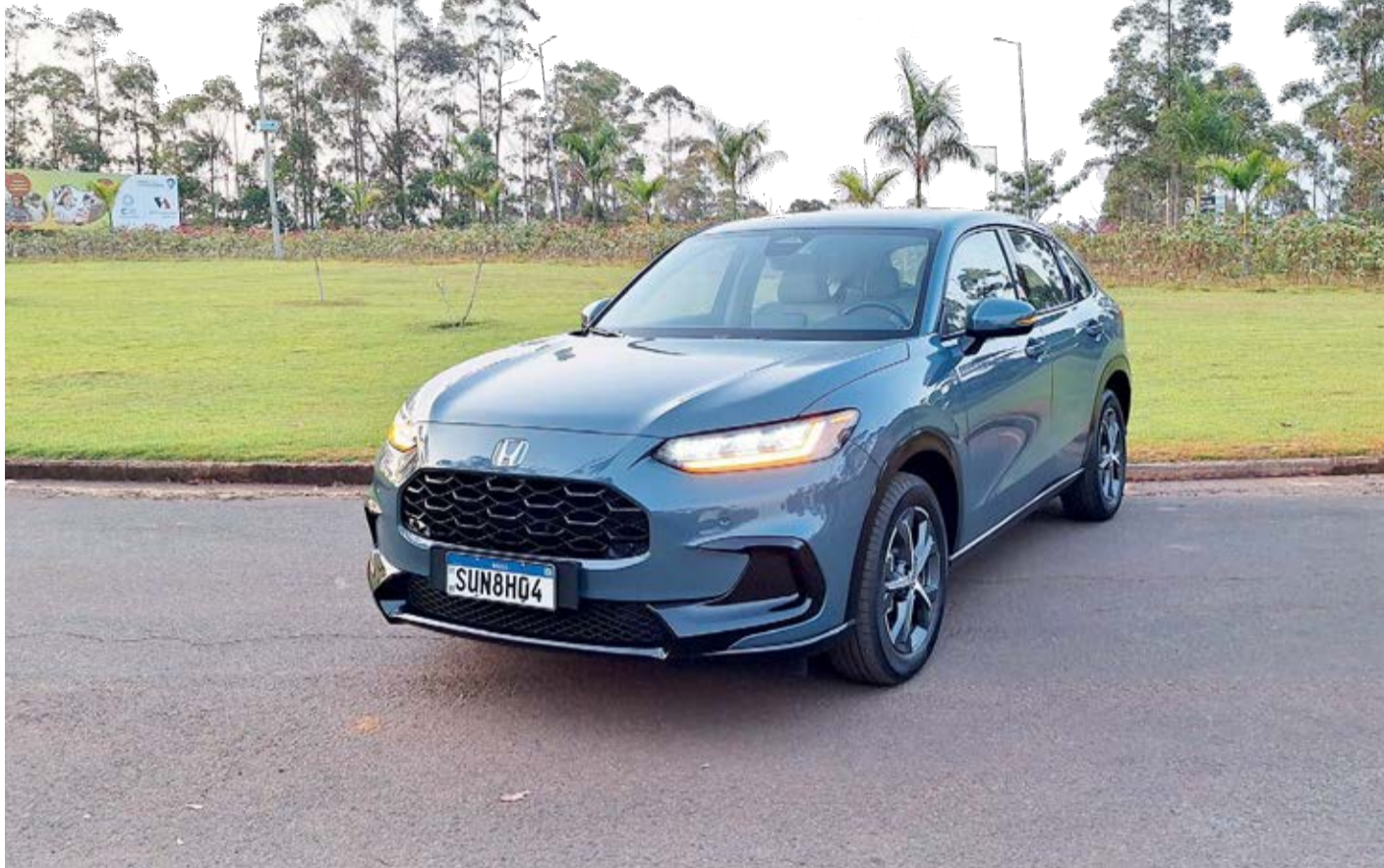
SUV Honda ZR-V Touring: Modelo tem linhas mais arredondadas e a grade frontal em colmeia e na cor preto brilhante

No visual, destaque para as linhas arredondadas da carroceria, a grade ovalada em colmeia na cor preto brilhante, as rodas de liga de 17 polegadas e todas as luzes completamente