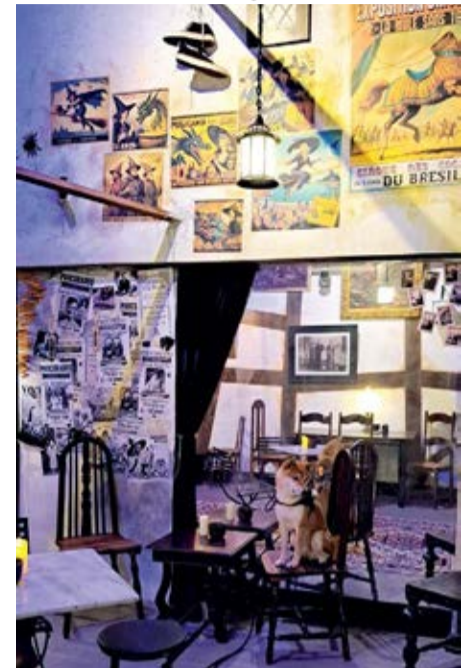
Cachorro Sinistro: O bar fica na Rua Alagoas 601, na Savassi, e promete oferecer uma vivência mágica e envolvente