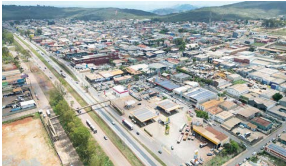
Energia fraca: Comerciantes e moradores do Jardim Canadá buscam solucionar os problemas de desequilíbrio de tensão e falta de energia no bairro