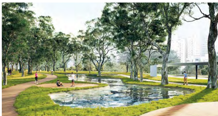
Linha férrea: O projeto prevê áreas revitalizadas para o lazer, esporte, criando uma nova alternativa de deslocamento e integração urbana para a região

De acordo com comerciantes do Belvedere, o problema começou na avenida principal do Belvedere, avançou pelas ruas transversais, indicando que a capacidade máxima de veículos das vias foi esgotada, gerando lentidão generalizada. O congestionamento se espalhou por toda a malha viária da região.