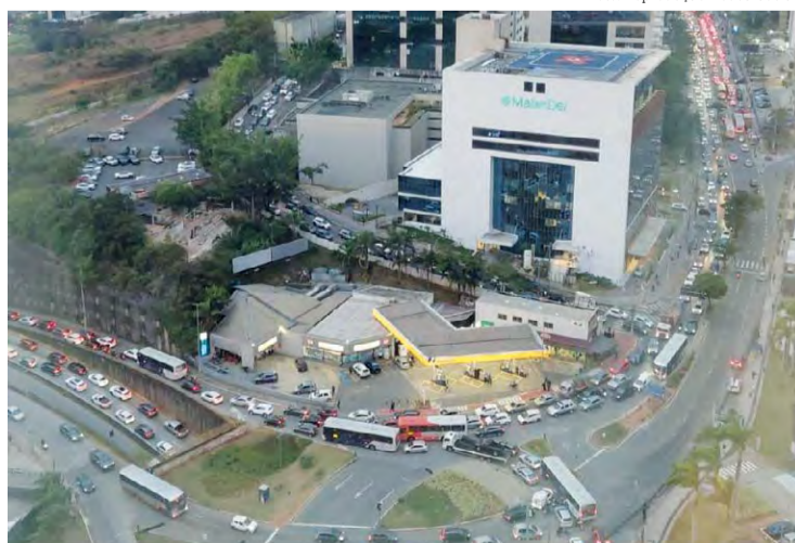
Colapso no trânsito: “O que vivemos nesse dia precisa ficar como um alerta para o poder público”.

visões, com paralisação e lentidão excessiva que levou ao colapso. O volume de veículos superou a capacidade da via e o tempo perdido dentro do carro ultrapassou o limite de tolerância. O trânsito entrou em colapso, literalmente”, desabafou.