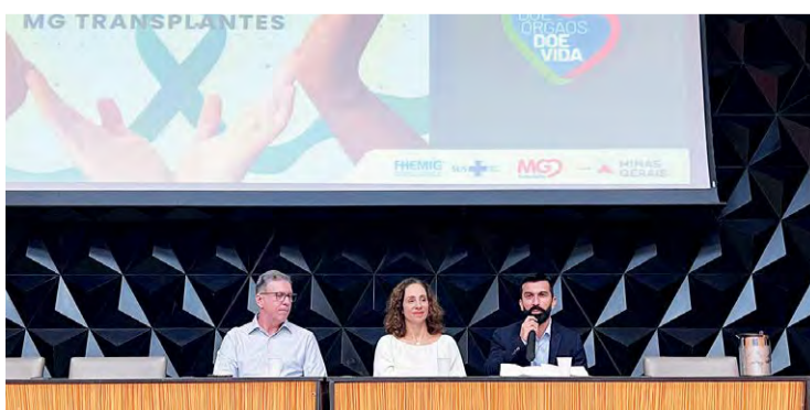
Medula Óssea: A coordenação do MG Transplantes anunciou a criação do Núcleo de Medula Óssea

O MG Transplantes agora possui um Núcleo de Medula Óssea, que irá organizar fluxos, possibilitar mais agilidade para casos complexos e, ainda, fortalecer as políticas relacionadas aos procedimentos realizados no Estado. A reformulação da rede fortalece os papéis dos órgãos envolvidos no transplante de medula óssea em Minas Gerais, além de reforçar a atuação integrada entre o MG Transplantes e a Fundação Hemominas, responsável por atu-