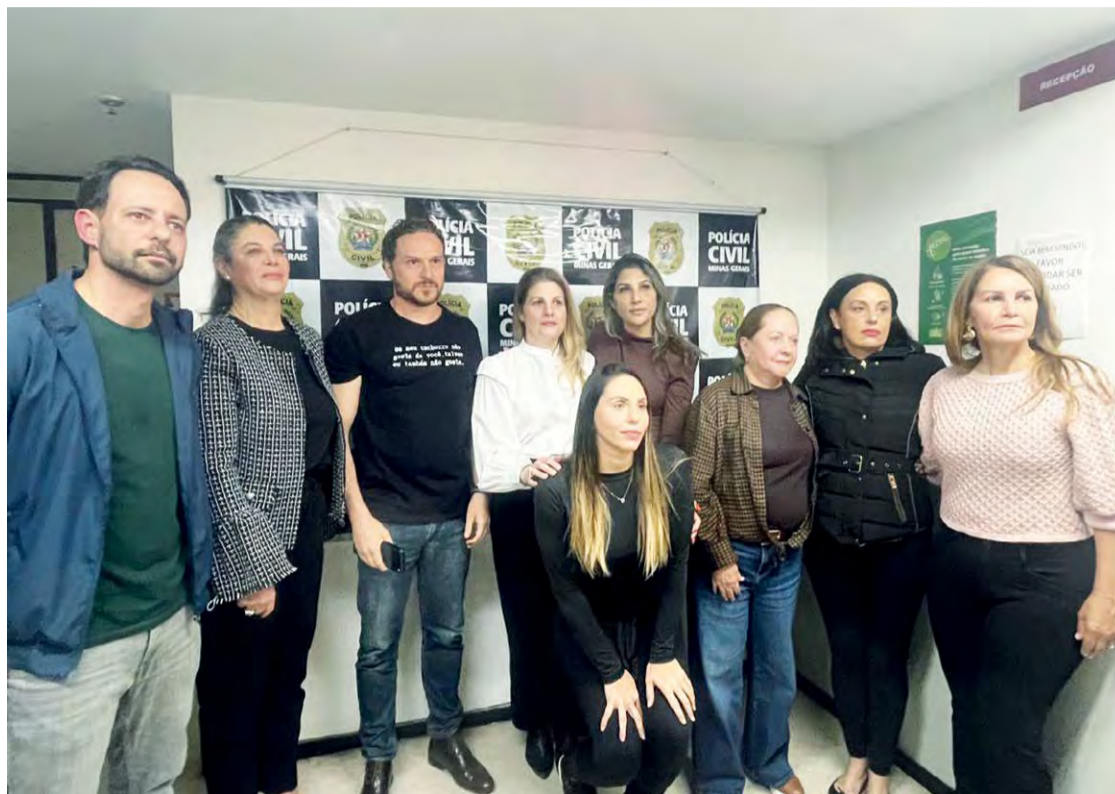
Investigação rigorosa: Moradoras e protetoras independentes de animais, juntamente com o deputado federal Fred Costa e o vereador Wanderley Porto, estiveram na Delegacia Especializada de Crimes Contra o Meio Ambiente

Segundo informações das protetoras, dos 15 gatos comunitários que são tratados duas vezes ao dia em uma das oito colônias de felinos, cerca de 10 animais estão desaparecidos, sendo cinco deles por óbito. A suspeita é que os mesmos tenham sido envenenados por "chumbinho", um agrotóxico clandestino usado ilegalmente como veneno de