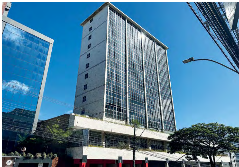
Hospital Raja: A unidade está instalada na Avenida Raja Gabáglia, em uma localização estratégica, próxima ao Hospital Luxemburgo