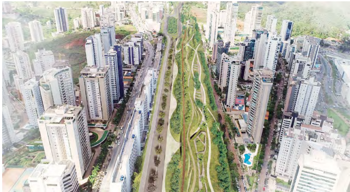
Mobilidade: A área possibilitará a Avenida Parque, com implantação de uma nova via de circulação em ambos os sentidos com novas vias de trânsito

A doação do terreno chega como um alento em um momento de pressão da população para obras de arte de mobilidade, principalmente, após o colapso no trânsito da região, ocorrido no último dia 1º de junho, quando moradores e trabalhadores da região ficaram parados no trânsito por mais de