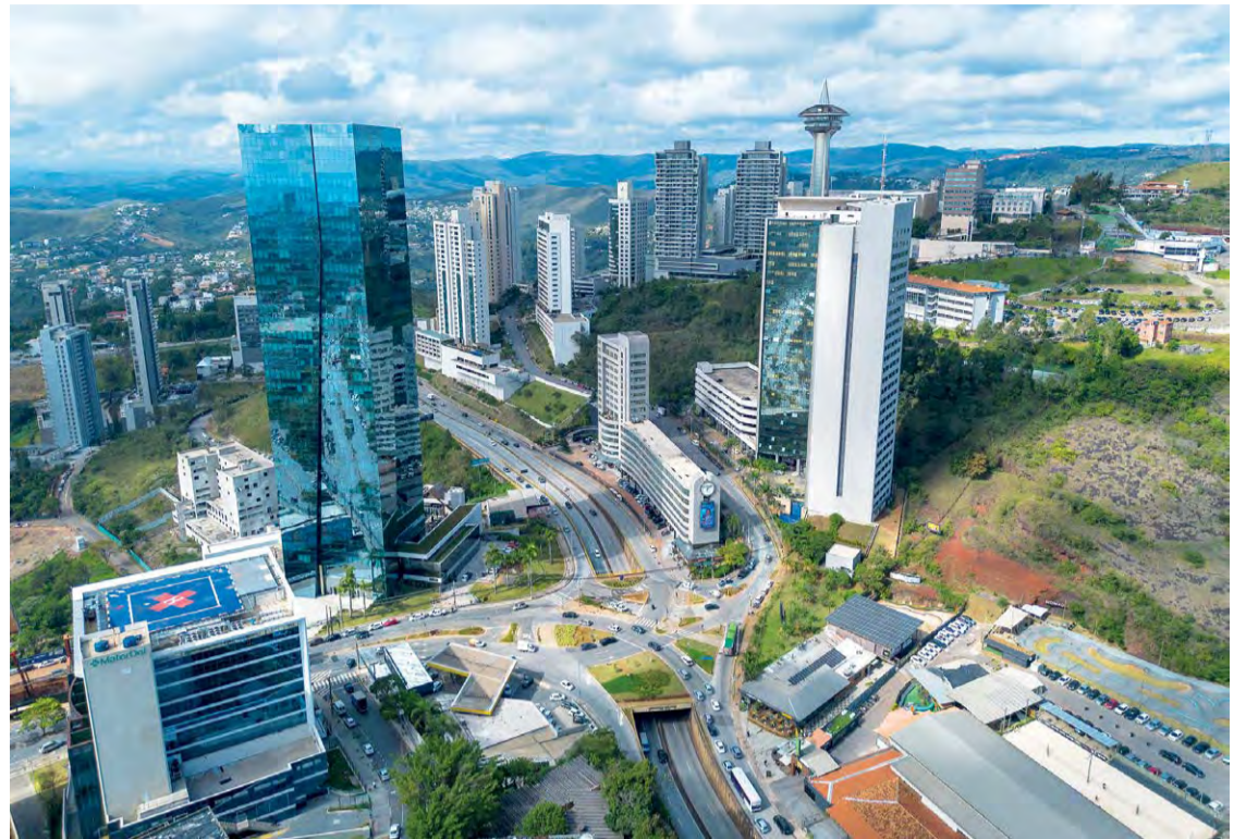
Investimentos: Nova Lima voltou a ganhar destaque nacional ao conquistar o primeiro lugar em qualidade de vida em Minas Gerais

A educação também tem papel importante no reconheci-