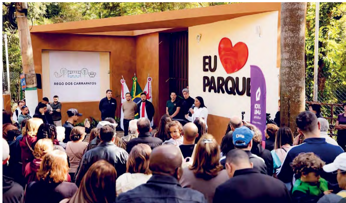
Parque Rego dos Carrapatos: A Portaria 2, localizada no Bairro Retiro, foi concebida para oferecer mais um acesso da população em contato com a natureza e de momentos de lazer