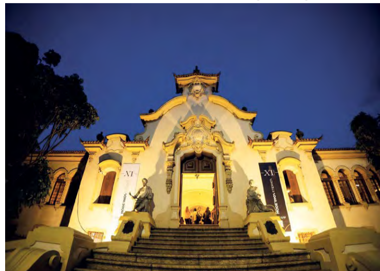
Modernos Eternos BH: A edição da mostra acontece na Escola Estadual Pedro II, no Centro, em Belo Horizonte

A 11ª Modernos Eternos BH conta com uma Ala Gourmet distribuída pelos pátios internos da escola, com duas