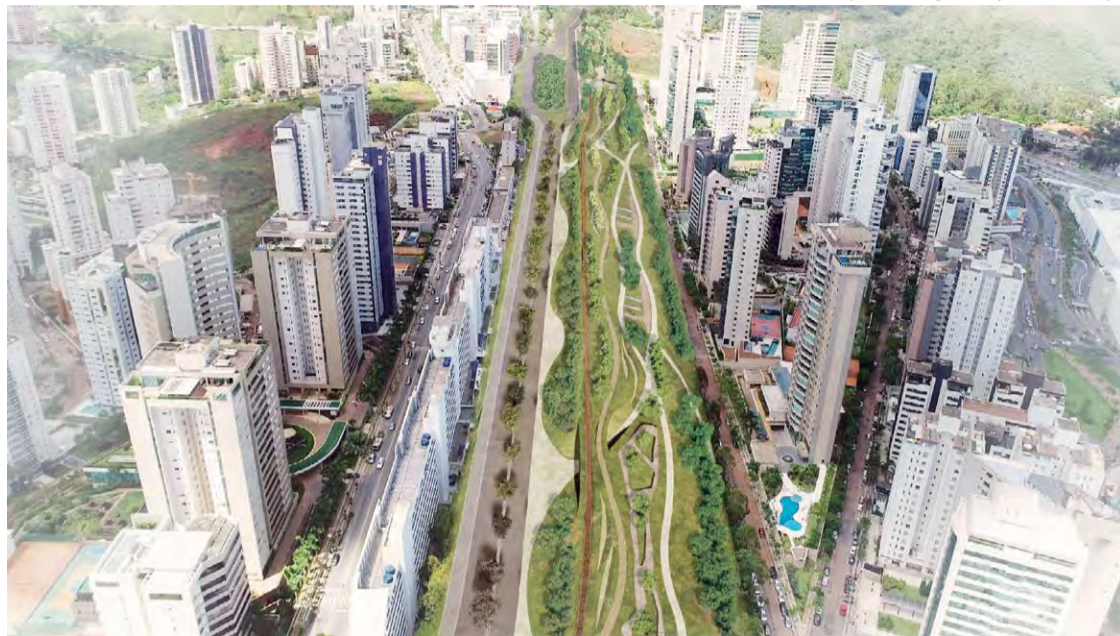
Avenida Parque: A antiga linha férrea do Ramal Ferroviário de Águas Claras representa uma etapa fundamental para a viabilização do Projeto localizado entre o Belvedere e Vila da Serra

A determinação do governo federal ampliará as al-